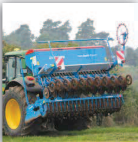
Vhodné přenesení těžiště pomocí hydrauliky