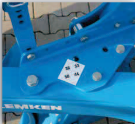
Přestavení šířky pracovního záběru