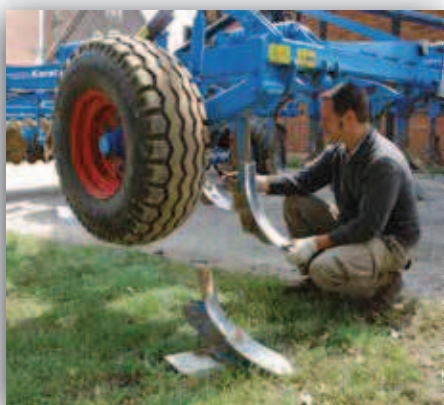
Rychlá a jednoduchá výměna radliček

bez použití náradí tak, aby bylo možné kypřič přizpůsobit rozdílným požadavkům na mělké nebo hluboké zpracování půdy.