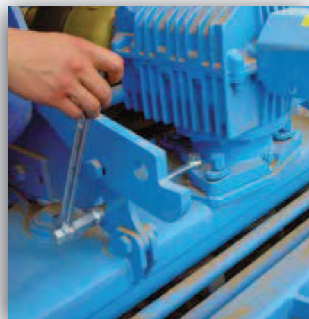
Změna směru otáčení pro nejrůznější podmínky nasazení