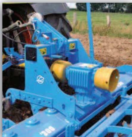
Robustní převodovka s výměnnými koly